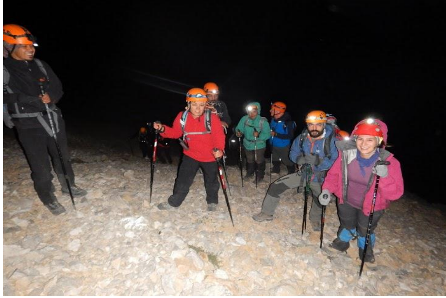
Yan geçişten kareler...